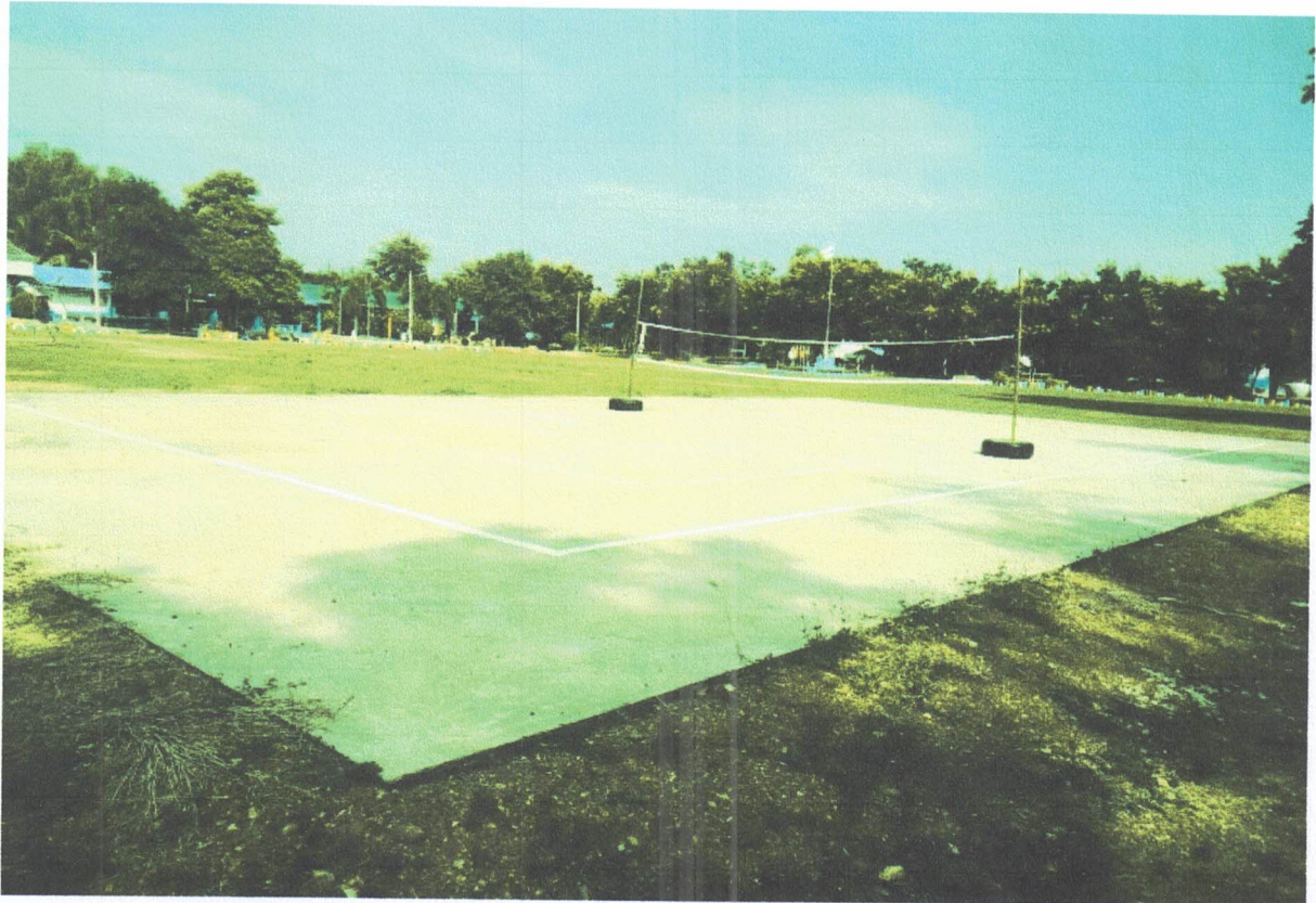
รูปลานกีฬาหญ้า 6